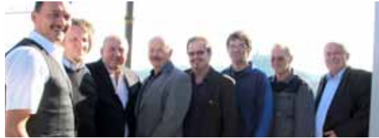
▶ AK-Präsident zu Besuch in der BAG Ölmühle in Güssing.