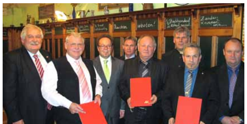
▶ Ehrung langjähriger MitarbeiterInnen der Firma Südburg