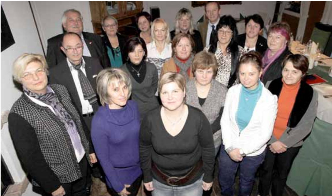
◀ Ehrung von lang-jährigen MitarbeiterInnen der Firma Triumph in Oberwart.