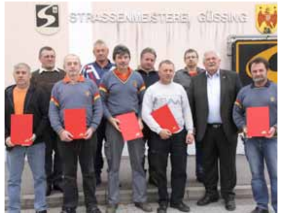
▶ Ehrung von langjährigen Mitarbeitern im Bau- und Betriebsdienstleistungszentrum in Güssing.