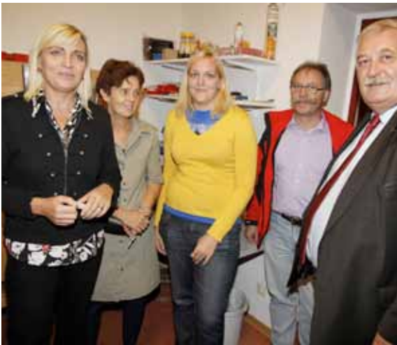
▲ Betriebsbesuch bei Pro-Mente in Lackenbach.