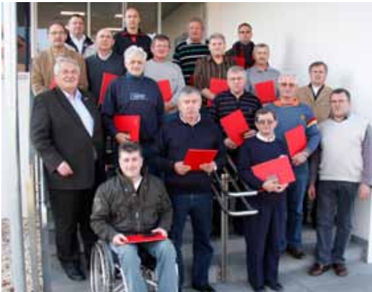
◀ Ehrung von langjährigen Mitarbeitern im Bau- und Betriebsdienstleistungszentrum in Oberwart.