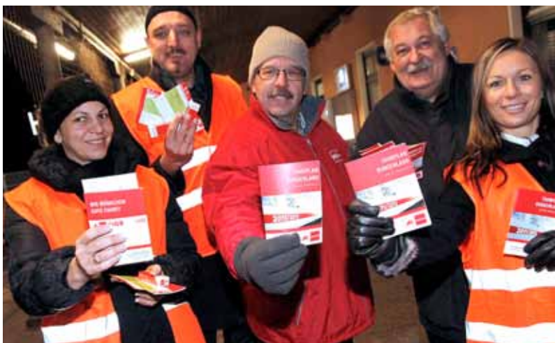
AK-Pendleraktion am 6. Dezember früh auf allen Bahnhöfen: Funktionäre und Mitarbeiter verteilen Fahrpläne und Umfragekarten (im Uhrzeigersinn: in Neusiedl am See, Mattersburg, Deutschkreutz und Wulkaprodersdorf).