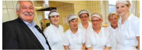
▲ AK-Präsident zu Besuch im Pflegeheim St. Vinzenz in Pinkafeld.